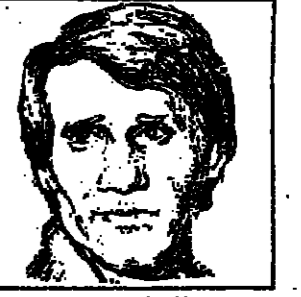
عبد الحليم حافظ في باريس